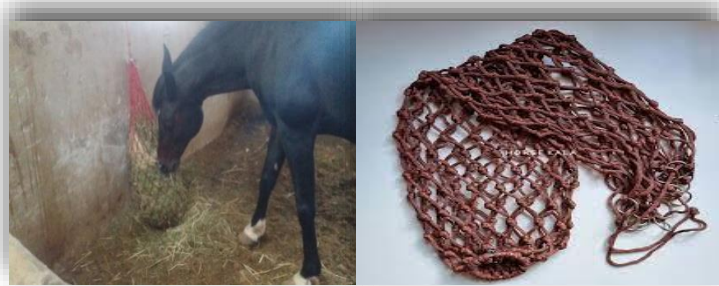
شکل ۱- توری یونجه و نحوه دسترسی اسب‌ها به علوفه Figure 1. A hay net and horses access to forage

کیلوگرم علوفه بودند (شرکت هورس کالا، کرمانشاه، ایران). نحوه دسترسی اسب‌ها به علوفه در داخل توری در شکل ۱ نشان داده شده است.