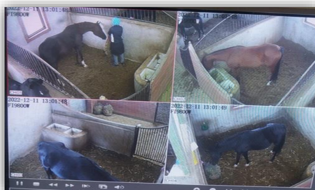
شکل ۲- ضبط رفتارهای تغذیه‌ای در اسب‌های استفاده‌کننده از توری و بدون توری خوراک Figure 2. Recording feeding behaviors in horses using nets and without feed nets

زمانی که به‌صورت آزاد (بدون توری) تغذیه شدند، ۱۵۹۲ گرم در ساعت خوراک مصرف کردند که به‌طور معنی‌داری بیشتر ( P < 0.05 ) از اسب‌های محدودشده با توری (۶۱۰ گرم در ساعت) بود. مشابه با نتایج مطالعه حاضر، استفاده از توری کندکننده در تغذیه اسب‌ها سبب افزایش مدت‌زمان مصرف خوراک در اسب‌ها شد (Glunk et al. , 2014; Ellis et al. , 2015). افزایش زمان مصرف علوفه و کاهش همزمان نرخ مصرف علوفه برای بسیاری از اسب‌های بالغ منجر به افزایش سرعت عبور مواد غذایی از طریق دستگاه گوارش می‌شود (Siciliano & Schmitt, 2012).