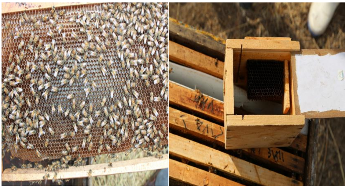
شکل ۱- جمع‌آوری زنبورهای پرستار جوان از روی قاب لارو جوان و انتقال آن به داخل قفس Figure 1. Collecting young nurse bees from the frame of the young larva and transferring it into the cage

برای تهیه‌ی گرده آفتابگردان، بعد از اطمینان از سالم بودن کندوهای زنبورعسل از هرگونه بیماری باکتریایی، قارچی و ویروسی، همزمان با گلدهی این گیاه در شهریور ماه ۱۳۹۷،