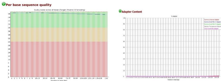
شکل ۱- آزمون کنترل کیفیت تک‌نوکلئوتیدی (چپ) و آزمون محتوای آداپتوری (راست) مربوط به نمونه "SRR11050964". Figure 1. Per base sequence quality (Left) and Adapter content (Right) related to "SRR11050964" sample.

پس از تبدیل فرمت داده‌ها و انجام سنجش کنترل کیفیت، طبق گزارش حاوی آماره‌های پایه، توالی‌های بین ۲۸ تا ۳۳ میلیون خوانش کوتاه جفتی (از هر دو انتهای توالی‌یابی شده) با طول ۱۵۰ جفت باز برای نمونه‌ها به‌دست آمد. در آزمون کنترل کیفیت تک نوکلئوتیدی، محور افقی نمودار بیانگر موقعیت هر جفت باز بر روی خوانش و محور عمودی بیانگر نمره فرود (phred score) است که نمونه با نمره بالاتر از ۲۸ (منطقه سبز) به‌عنوان نمونه با کیفیت بالا تلقی می‌شود که طبق گراف مربوط به نمونه موردنظر، کیفیت نمونه بسیار عالی می‌باشد و نیز در آزمون محتوای آداپتوری، محور افقی نمودار بیانگر موقعیت هر جفت باز بر روی خوانش و محور عمودی بیانگر درصد محتوای آداپتوری در طول خوانش است که طبق راهنمای رنگ خطوط بر روی نمودار، در انتهای خوانش مقدار