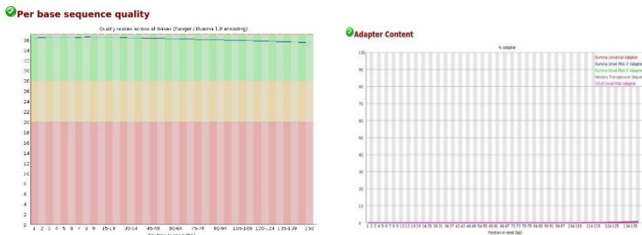
شکل ۱- آزمون کنترل کیفیت تک‌نوکلئوتیدی (چپ) و آزمون محتوای آداپتوری (راست) مربوط به نمونه "SRR11050964". Figure 1. Per base sequence quality (Lert) and Adapter content (Right) related to "SRR11050964" sample.

پس از تبدیل فرمت داده‌ها و انجام سنجش کنترل کیفیت، طبق گزارش حاوی آماره‌های پایه، توالی‌های بین ۲۸ تا ۳۳ میلیون خوانش کوتاه جفتی (از هر دو انتهای توالی‌یابی شده) با طول ۱۵۰ جفت باز برای نمونه‌ها به‌دست آمد. در آزمون کنترل کیفیت تک نوکلئوتیدی، محور افقی نمودار بیانگر موقعیت هر جفت باز بر روی خوانش و محور عمودی بیانگر نمره فرود (phred score) است که نمونه با نمره بالاتر از ۲۸ (منطقه سبز) به‌عنوان نمونه با کیفیت بالا تلقی می‌شود که طبق گراف مربوط به نمونه موردنظر، کیفیت نمونه بسیار عالی می‌باشد و نیز در آزمون محتوای آداپتوری، محور افقی نمودار بیانگر موقعیت هر جفت باز بر روی خوانش و محور عمودی بیانگر درصد محتوای آداپتوری در طول خوانش است که طبق راهنمای رنگ خطوط بر روی نمودار، در انتهای خوانش مقدار