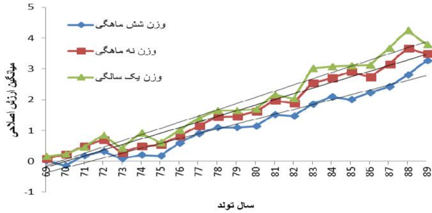
شکل ۲- روند ژنتیکی مستقیم صفات بعد از شیرگیری در بره‌های لری‌بختیاری Picture 2. Direct genetic trend of growth traits at post-weaning in Lori-Bakhtiari lambs