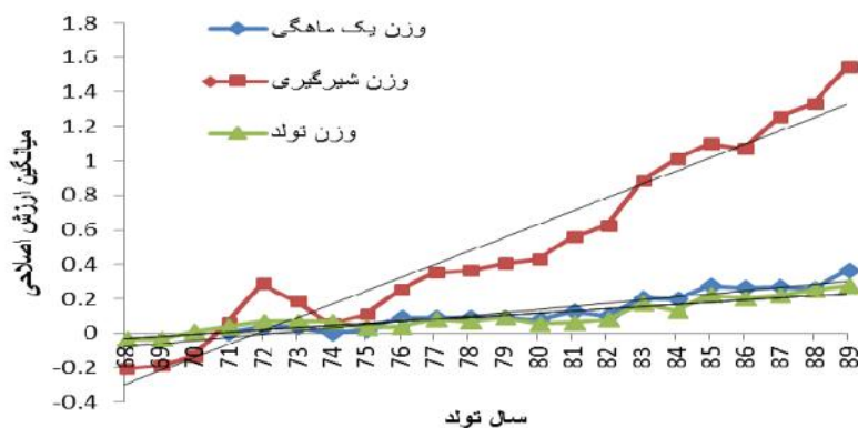
شکل ۱- روند ژنتیکی مستقیم صفات رشد قبل از شیرگیری در بره‌های لری بختیاری Picture 1. Direct genetic trend of growth traits at pre-weaning in Lori-Bakhtiari lambs

** نشان دهنده معنی‌داری در سطح ۰/۰۱، ns نشان‌دهنده عدم معنی‌داری بودن آماری، R 2 ضریب تبیین، AGT: روند ژنتیکی دام، MGT: روند ژنتیکی مادری، PHT: روند فنوتیپی، IT: روند محیطی