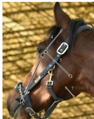
شکل ۲- اندازه‌گیری‌های نمای جانبی سر اسب Figure 2. Measurements on the horse head side view