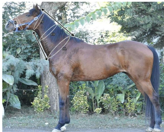
شکل ۳- اندازه‌گیری‌های نواحی گردن و پوزه اسب Figure 3. Measurements on the muzzle circumference and horse neck regions