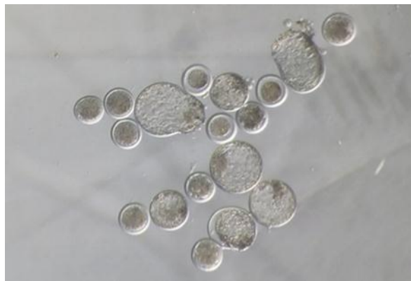
شکل ۲- تصویر استریومیکروسکوپ از بلاستوسیست‌های در حال جوانه زدن Figure 2. Stereomicroscope image of germinating blastocyst

برای ارزیابی اثر افزودن لیپوپلی‌ساکارید به محیط کشت بلوغ بر درصد تسهیم و تولید بلاستوسیست‌ها، تخمک‌های بالغ‌شده سه بار در محیط HEPES-buffered SOF شسته و بلافاصله در قطره‌های ۵۰ میکرولیتری از محیط SOF با چهار واحد بین‌المللی بر میلی‌لیتر هپارین، ۲۰ میکرومولار پنی‌سیلین‌آمین، ۱۰ میکرومولارهایپوتاتورین، یک میکرومولار اپی‌نفرین دو درصد (حجم/حجم) سرم میش فحل قرار داده شدند. سپس پایوت‌های اسپرم منجمد در آب ۳۵ درجه سانتی‌گراد برای مدت ۳۰ ثانیه ذوب شدند و اسپرم‌ها با تحرک بالا با روش شناورسازی جدا شدند. اسپرم‌های جداشده با غلظت نهایی 2 \times 10^6 اسپرم در هر میلی‌لیتر به قطره‌های لقاح برون‌تنی که در هر قطره ۱۰