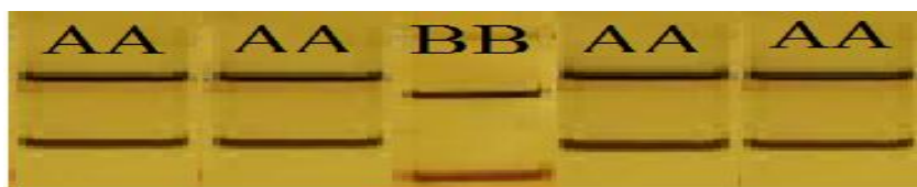
شکل ۲- ژنوتیپ‌های مشاهده شده برای ژن گیرنده پرولاکتین در جمعیت بلدرچین ژاپنی Figure 2. Observed genotypes for Prolactin receptor gene in Japanese Quail population