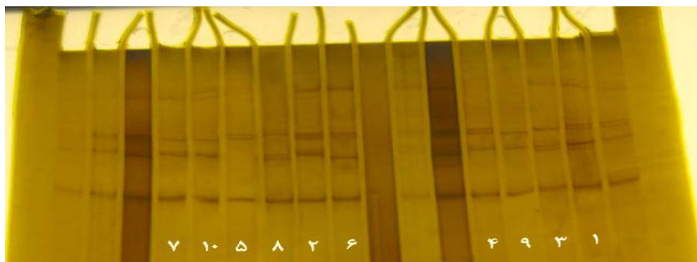
شکل ۳- پلی مورفیسیم حاصل از تکنیک SSCP در ژن لپتین در گوسفند آمیخته لری بختیاری - افشاری با ۱۰ الگوی متفاوت Figure 3. SSCP polymorphism of Lori Bakhtiari- Afshari Hybrid sheep in leptin gene with ten different patterns (genotype)

الگوی شماره ۲ (۲۸/۵۸) و کمترین درصد فراوانی را الگوی شماره ۶ (۲/۳۸) دارا است (جدول ۴). نتایج تجزیه و تحلیل داده‌های آماری میانگین، حداقل، حداکثر و انحراف معیار صفات مربوط به وزن تولد، وزن از شیرگیری، وزن شش ماهگی و وزن دوازده ماهگی نژاد لری بختیاری مورد بررسی قرار گرفت (جدول ۵).