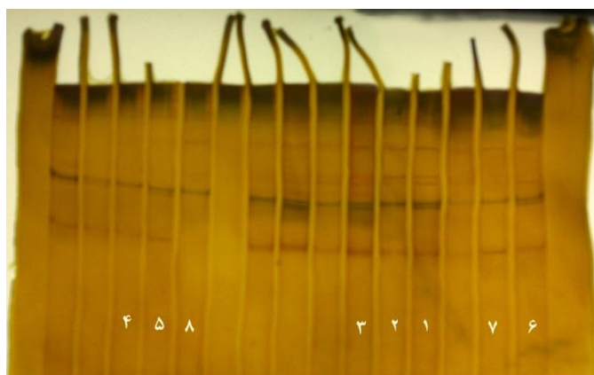
شکل ۲- پلی مورفیسیم حاصل از تکنیک SSCP در ژن لپتین گوسفند لری بختیاری با هشت الگوی متفاوت Figure 2. SSCP polymorphism of Lori- Bakhtiari sheep in leptin gene with eight different patterns (genotype)