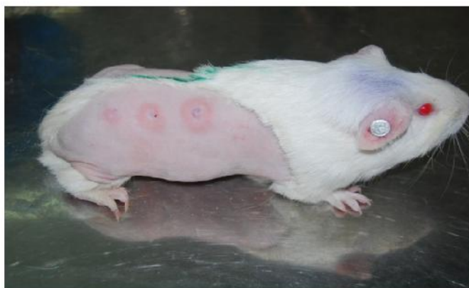
شکل ۴- تزریق پادگن ۶۰ و استاندارد توبرکولین انسانی و مشاهده نتایج تزریق به شکل هاله قرمز رنگ) Figure 4. Injection of antigen 60 and human tuberculin standard and observation of the injection results in the form of a red zone

با تزریق مقدار ۰/۱ میلی‌لیتر از استاندارد بین المللی توبرکولین انسانی و پادگن A60 به دو خوکچه حساس شده توسط مایکوباکتریوم بویس BCG و مایکوباکتریوم