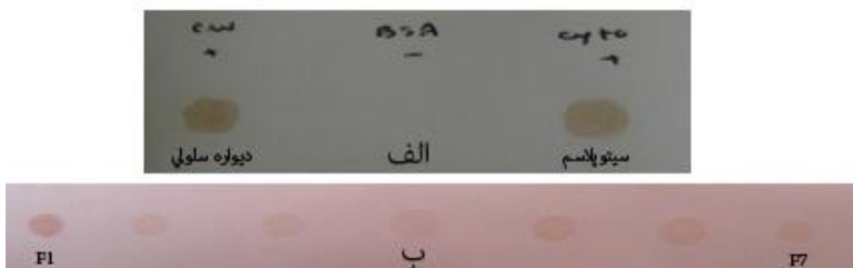
شکل ۱- بلات نقطه از دیواره سلولی، سیتوپلاسم (الف) و فراکسیون‌های حاصل از کروماتوگرافی (ب) Figure 1. Dot blotting from the cell wall, cytoplasm (a) and fractions of chromatography (b)

با انجام بلات نقطه‌ای، طی زمان ۱۰ تا ۲۰ دقیقه رنگ ظاهر گردید. لکه تیره رنگی که ایجاد شد، به این معنی است که هر دو جزء (سیتوپلاسم و دیواره سلولی) دارای پادگن ۶۰ می‌باشند (شکل ۱: الف).