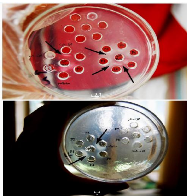
شکل ۲- ایمونوژل دیفیوژن سیتوپلاسم و فراکسیون‌های خروجی از ستون کروماتوگرافی با استفاده آنتی BCG (الف) و آنتی A60 (ب) Figure 1. Gel Immunodiffusion of cytoplasm and output fractions from chromatography column using anti BCG (a) and anti A60 (b).

در آگار ژل ایمونودیفیوژن نمونه سیتوپلاسم و تمامی فراکسیون‌های حاصل از کروماتوگرافی با Anti BCG واکنش مثبت نشان دادند (شکل ۲: الف). در مورد Anti A60