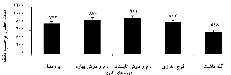
شکل ۱- میانگین مدت زمان حضور روزانه دام در عرصه در دوره های کاری مختلف.

با توجه به مطالب فوق در طول یکسال، پنج دوره فعالیتی متفاوت تعیین شد. در چهار دوره بره دنبال، دام