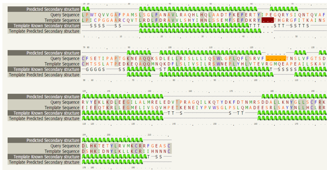
شکل ۳- هم‌ردیفی ساختار دوم پروتئین پیش بینی شده با پروتئین مرجع Figure 3. Alignment of the second structure of the predicted protein with the reference protein

در بررسی نتایج توالی‌یابی با GenBank accession no. X12546 معرفی شده در NCBI، در الگوی ۱ و ۲، در نوکلئوتیدهای ۱۴۸۶ و ۱۴۸۹ تغییرات باز را بصورت A به G و G به C در هر دو الگو مشاهده می‌کنیم و در الگوی ۱ و ۲، در نوکلئوتید ۱۳۴۳ اضافه شدن C مشاهده شد. در الگوی ۱، در نوکلئوتیدهای ۱۳۵۷ و ۱۳۵۸، حذف باز را داریم. در ژن گیرنده هورمون رشد، هیچگونه تفاوتی بین باندها مشاهده نگردید.