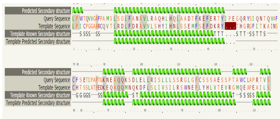
شکل ۵- ساختار دوم پروتئین پیش‌بینی شده با وجود جهش‌ها و هم‌ردیفی با پروتئین‌های مرجع Figure 5. The second structure of predicted protein with the presence of mutations and alignment with reference

در رابطه با ساختار سوم برای پروتئین جهش یافته برای هر دو الگو همانطور که مورد انتظار بود نتایج نشان داد که پروتئین تولید شده در مقایسه با پروتئین اصلی فاقد جهش فقط حاوی دو زنجیره است، و لذا می‌تواند فاقد عملکرد باشد. ساختار دوم با وجود جهش‌ها و هم‌ردیفی با پروتئین‌های مشابه: