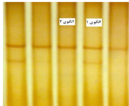
شکل ۱- الگوهای موجود در ژل SSCP از یک قطعه 214 جفت بازی از ژن GH Figure 1. Patterns in the SSCP gel of a fragment with 214 bp of GH gene

Y_{ijklko} = \mu + A_i + G_j + D_k + B(W_{ijklko}) \bar{W} + (AG)_{il} + e_{ijklko} Y_{ijklko} : هر یک از مشاهدات مربوط به صفات وزن لاشه، ضخامت چربی پشت، سطح تری گلیسرید و کلسترول خون از تمام دامهای خونگیری شده، \mu : میانگین جمعیت، A_i : اثر آمین سن حیوان در هنگام خون‌گیری (سن حیوان با بررسی دندان آنها تعیین و ثبت می‌شود)، G_j : اثر I آمین ژنوتیپ ژن مورد نظر (GH و GHR)، D_k : اثر k مین روز نمونه‌گیری، B: ضریب رگرسیون Y روی W (وزن دامها در هنگام خون‌گیری)، W_{iilo} : وزن دامها در هنگام خونگیری، میانگین وزن دامها در هنگام خون‌گیری، (AG)_{il} : اثر متقابل بین سن و ژنوتیپ، e_{iilo} : اثر سایر عوامل تصادفی. پس از آنالیز واریانس و مشخص نمودن اثر هر یک از عوامل بر صفات مورد بررسی، مقایسه میانگین حداقل مربعات سطوح مختلف ژن‌های GH و GHR با آزمون توکی انجام گرفت.