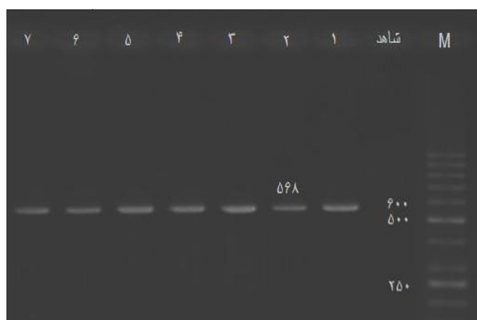
شکل ۲- الکتروفورز محصولات PCR (ژن UTMP)

ایجاد دو قطعه ۳۶۸ و ۴۵۸ جفت بازی شد و مسبب ژنوتیپ CC شد. قطعه برش نخورده ۸۲۶ جفت بازی بیانگر ژنوتیپ TT و سه قطعه ۸۲۶، ۳۶۸ و ۴۵۸ جفت بازی، نشان‌دهنده ژنوتیپ CT می‌باشد (شکل ۳).