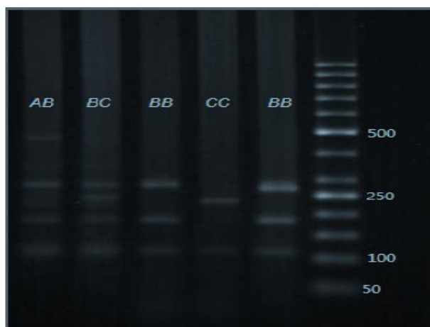
شکل ۴- الکتروفورز محصولات حاصل از هضم برای ژن UTMP توسط آنزیم BsrI

جدول ۱- فراوانی‌های آلی و ژنوتیپی ژن‌های OPN و UTMP به همراه خطای معیار آنها