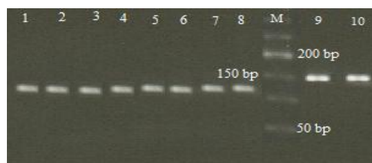
شکل ۲- الگوی باندهای جایگاه BMP15(B4): شماره‌های ۹ و ۱۰ محصول PCR (۱۵۳ جفت باز)، شماره‌های ۱ تا ۸ محصول هضم آنزیمی (۱۲۲ و ۳۱ جفت باز) تمام نمونه‌ها دارای ژنوتیپ تیپ وحشی می‌باشند.

شامل BMP15 و GDF9 می‌باشند. FSH یک عامل ضروری برای چرخه فولیکولی طبیعی در جنس ماده است (۱۴،۱۳). نتایج آزمایشگاهی نشان می‌دهد که فاکتورهای مشتق از اووسیت قابلیت آن را