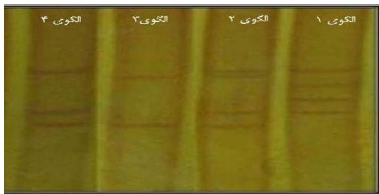
شکل ۲- الگوهای بانندی ژن ۳۰۹ جفت بازی DGAT1 حاصل از SSCP محصولات PCR

محصولات ۳۰۹ جفت بازی حاصل از واکنش زنجیره‌ای پلیمرز، بعد از تک رشته‌ای شدن به روش SSCP روی ژل اکریل آمید