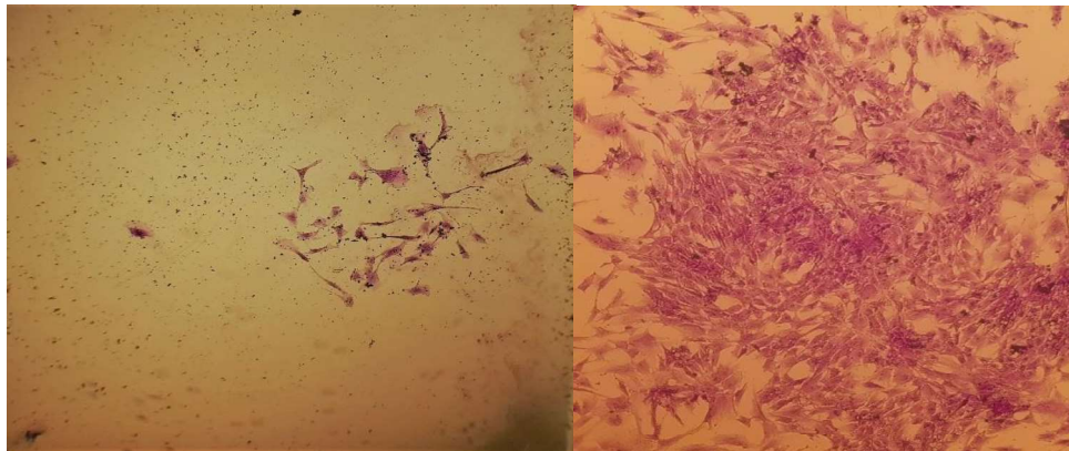
شکل ۴- کلنی سلولی در پاساژ ۵ با تراکم 520/cm^2 Figure 4. Cell colony at passage 5 and density of 520/cm^2