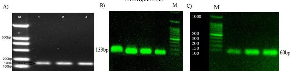
شکل ۲- الکتروفورز محصولات واکنش زنجیره ای پلیمرز. A: ژن بتاکتین B: اووموئید C: اووالبومین روی ژل آگارز ۲ درصد. M: مارکر مولکولی ۱۰۰ bp