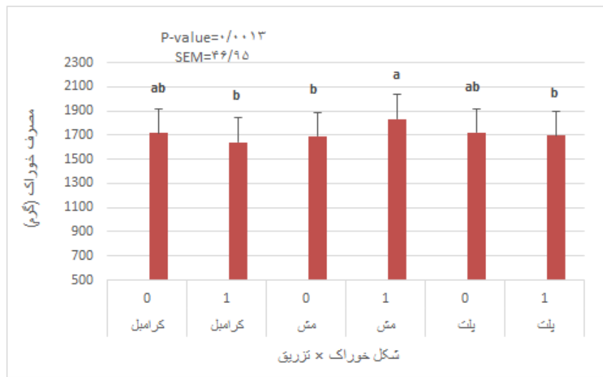
شکل ۱- اثر متقابل تیمارهای مختلف بر مصرف خوراک (گرم) جوجه‌های گوشتی در سن ۱۴ تا ۴۲ روزگی Figure 1. Interaction between different treatments on feed intake (gr) of chicken in day 14 to 42 of age