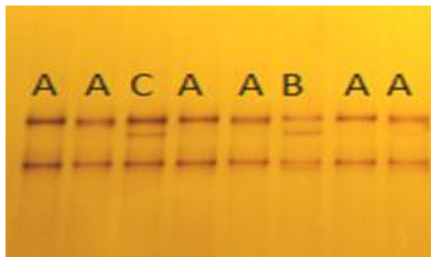
شکل ۱- الگوهای متفاوت SSCP در قطعه تکثیر شده ژن بتا-۴-دیفنسنین گاو Figure 1. Different SSCP patterns in amplified fragment of bovine B4-defensin

مشاهده شد (شکل ۲) که ژنوتیپ‌های این جهش برای الگوهای A، B و C به ترتیب CC، CT و TT بودند.