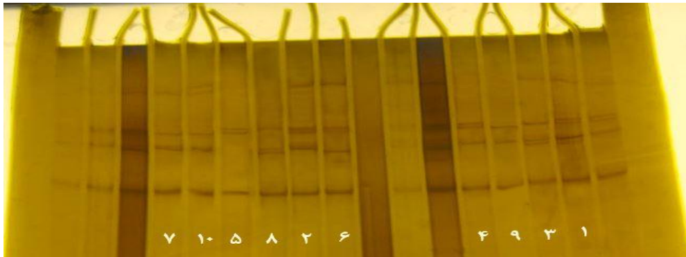
شکل ۳- پلی مورفیسیم حاصل از تکنیک SSCP در ژن لپتین در گوسفند آمیخته لری بختیاری - افشاری با ۱۰ الگوی متفاوت Figure 3. SSCP polymorphism of Lori Bakhtiari- Afshari Hybrid sheep in leptin gene with ten different patterns (genotype)

الگوی شماره ۲ (۲۸/۵۸) و کمترین درصد فراوانی را الگوی شماره ۶ (۲/۳۸) دارا است (جدول ۴). نتایج تجزیه و تحلیل داده‌های آماری میانگین، حداقل، حداکثر و انحراف معیار صفات مربوط به وزن تولد، وزن از شیرگیری، وزن شش ماهگی و وزن دوازده ماهگی نژاد لری بختیاری مورد بررسی قرار گرفت (جدول ۵).