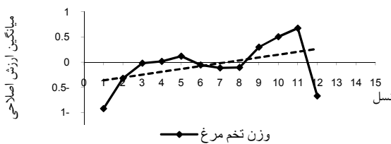
شکل ۴- روند ژنتیکی صفت وزن تخم مرغ.

روند ژنتیکی وزن بدن در سن ۱۲ هفتگی بدون در نظر گرفتن جنسیت، برای داده‌ها مربوط به ۱۱ نسل افزایشی بود. ضریب تابعیت میانگین ارزش اصلاحی ۲/۰۱ بود. (شکل ۳). در مطالعه قربانی و همکاران (۵) این روند ۲۲/۷۳ گزارش شد. روند ژنتیکی برای