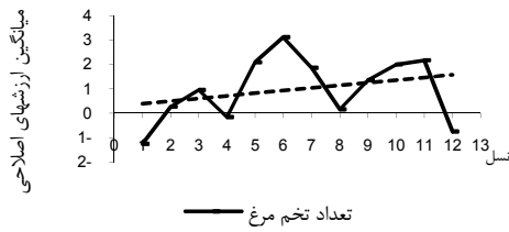
شکل ۲- روند ژنتیکی صفت تعداد تخم مرغ.