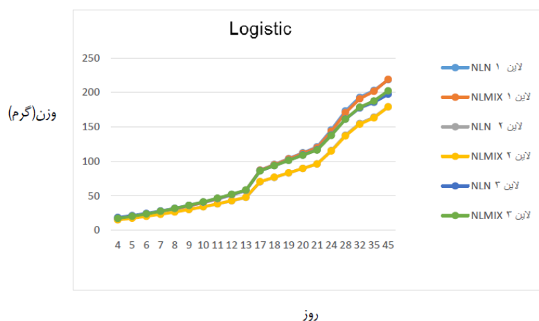
شکل ۲- پیش‌بینی وزن بدن بلدرچین توسط مدل لجستیک به صورت غیرخطی و غیرخطی مختلط

ارزیابی وزن بدن در طی رشد در اصلاح نژاد، مدیریت و اهداف تجاری حائز اهمیت است از طرفی برآوردهای وراثت پذیری پارامترهای منحنی رشد به طور متوسط بالاست (۶). این اطلاعات برای بازاریابی و پیش‌بینی‌های تجاری، دادن اطلاعات در مورد پیش‌بینی‌های تولید، و همچنین برای تعیین سیستم تغذیه مناسب مهم می‌باشد.