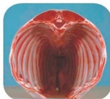
شکل ۲- تصویر ماهیچه چشمی در لاشه دام Figure 2. Image of eye muscle in animal carcass