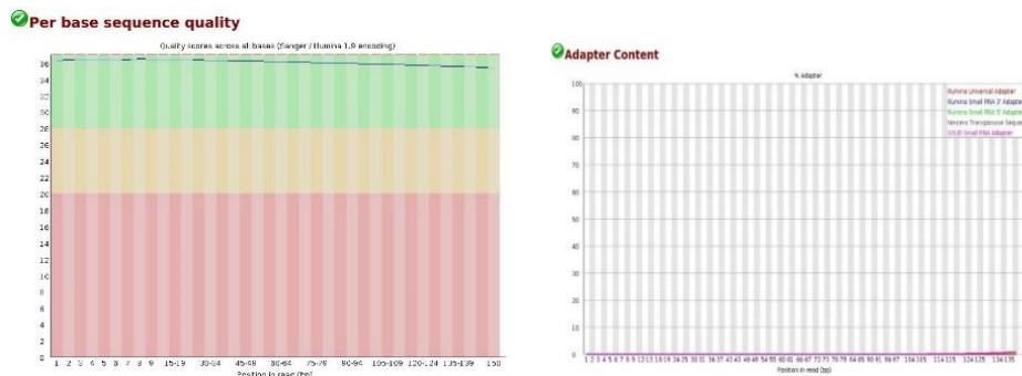
شکل ۱- آزمون کنترل کیفیت تک‌نوکلئوتیدی (چپ) و آزمون محتوای آداپتوری (راست) مربوط به نمونه "SRR11050964". Figure 1. Per base sequence quality (Lert) and Adapter content (Right) related to "SRR11050964" sample.

پس از تبدیل فرمت داده‌ها و انجام سنجش کنترل کیفیت، طبق گزارش حاوی آماره‌های پایه، توالی‌های بین ۲۸ تا ۳۳ میلیون خوانش کوتاه جفتی (از هر دو انتهای توالی‌یابی شده) با طول ۱۵۰ جفت باز برای نمونه‌ها به‌دست آمد. در آزمون کنترل کیفیت تک نوکلئوتیدی، محور افقی نمودار بیانگر موقعیت هر جفت باز بر روی خوانش و محور عمودی بیانگر نمره فرود (phred score) است که نمونه با نمره بالاتر از ۲۸ (منطقه سبز) به‌عنوان نمونه با کیفیت بالا تلقی می‌شود که طبق گراف مربوط به نمونه موردنظر، کیفیت نمونه بسیار عالی می‌باشد و نیز در آزمون محتوای آداپتوری، محور افقی نمودار بیانگر موقعیت هر جفت باز بر روی خوانش و محور عمودی بیانگر درصد محتوای آداپتوری در طول خوانش است که طبق راهنمای رنگ خطوط بر روی نمودار، در انتهای خوانش مقدار